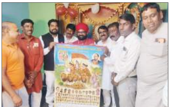
संगठन के पदाधिकारियों से संपर्क कर सकता है, उसकी समस्या का

बताया कि अगर समाज का कोई भी व्यक्ति परेशान है तो वह हमारे