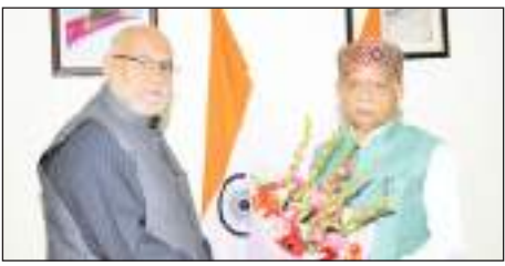
हिमाचल के भाजपा प्रभारी अविनाश राय खन्ना ने राज्यपाल शिव प्रताप शुक्ल से राजभवन में शिष्टाचार भेंट की।