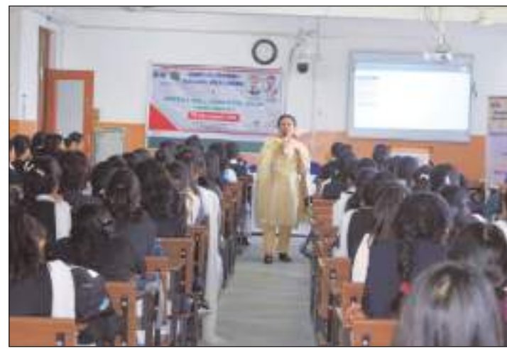
की चुनौतियों का सरलता का सामना कर छात्र सफल जीवन यापन कर सकें।

टीम एक्शन इंडिया/कंडाघाट/योगेश शर्मा जिला कौशल समिति द्वारा संकल्प आजीविका संवर्द्धन के लिए कौशल अर्जन और ज्ञान जागरूकता के तहत गत दिवस राजकीय पॉलिटिक महाविद्यालय कण्डाघाट में कैरियर परामर्श कार्यशाला आयोजित की गई। इस कार्यशाला में 200 से अधिक छात्रों ने भाग लिया। कार्यशाला का आयोजन हिमाचल प्रदेश कौशल विकास निगम द्वारा किया गया। जेपी सूचना प्रौद्योगिकी विश्वविद्यालय के कुलपति ने कार्यशाला का शुभारम्भ किया। उन्होंने इस अवसर पर छात्रों का आह्वान किया कि वे 21वीं सदी की आवश्यकताओं के अनुरूप कौशल ज्ञान अर्जित करें ताकि भविष्य