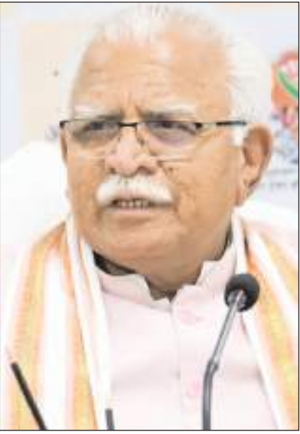
हरियाणा के मुख्यमंत्री मनोहर लाल खट्टर चंडीगढ़ में मीडिया से मुखातिब होते हुए।